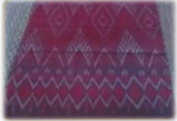
ผ้าไหม บ้านโสกตุ้ หมู่ที่ ๔