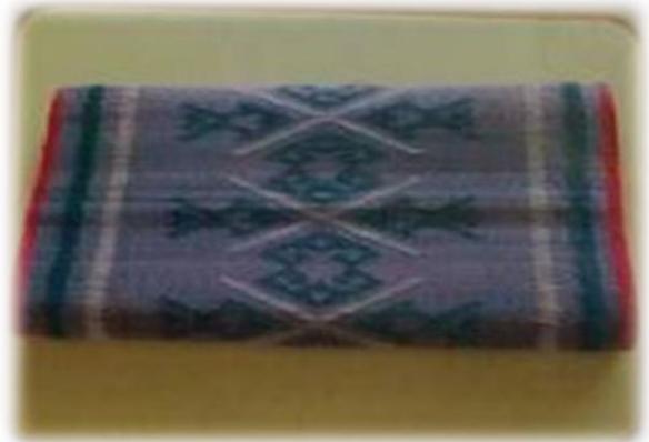
เสื่อกก บ้านหนองตุ้ หมู่ที่ ๑๐