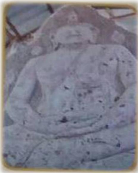
พระพุทธรูปหินทรายแกะสลักวัดศิริวิชัยวิทยาราม บ้านหินแร่ หมู่ที่ ๖