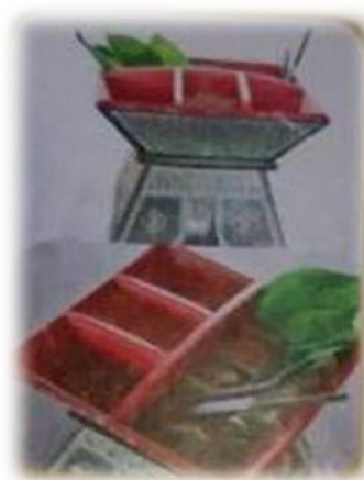
งานฝีมือ เขียนหมากโบราณ บ้านหินแร่