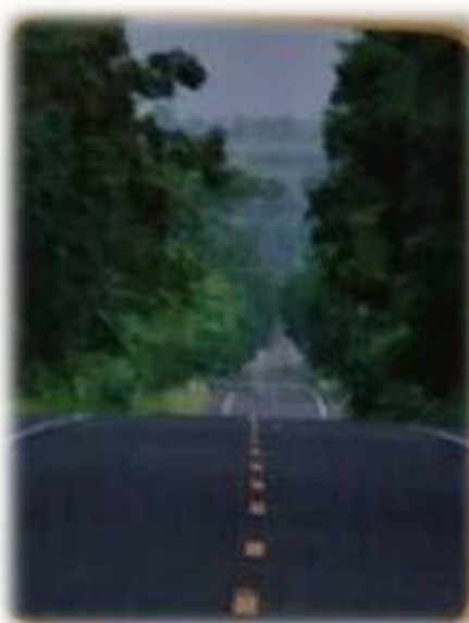
ถนนสายบ้านหนองจาน ไปบ้านอรุณพัฒนา