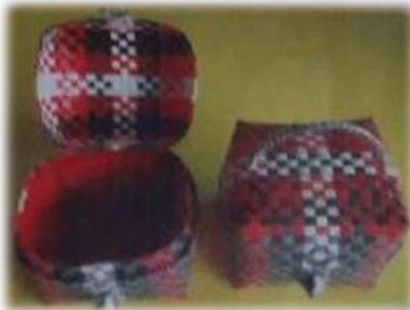
ตะกร้าราตรี บ้านหนองยาง หมู่ที่ ๔