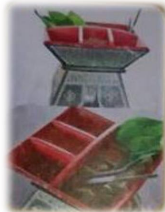
งานฝีมือ เขียนหมากโบราณ บ้านหินแร่