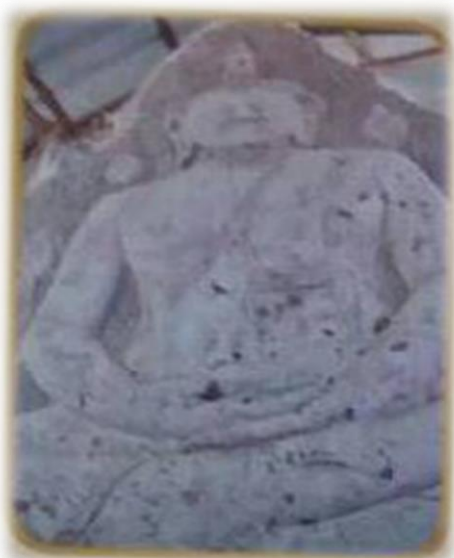
พระพุทธรูปหินทรายแกะสลักวัดศิริวิชัยวิทยาราม บ้านหินแร่ หมู่ที่ ๖