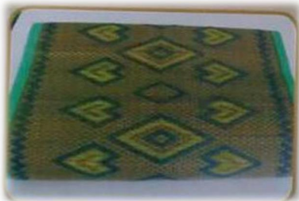
เสื่อกก บ้านโสกคู้ หมู่ที่ ๔