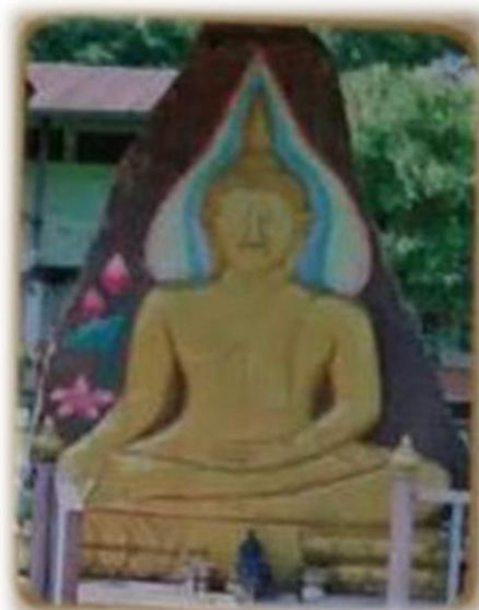
พระพุทธรูปหินทรายแกะสลักลงสี โรงเรียนบ้านหินแร่