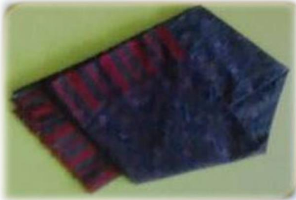
ผ้าไหม บ้านหนองตู หมู่ที่ ๑๐