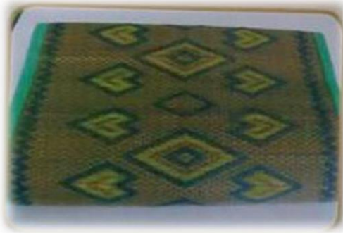
เสื่อกก บ้านโสกตุ้ หมู่ที่ ๔