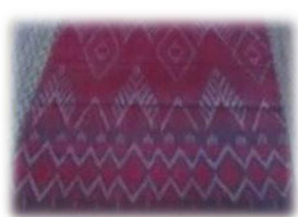
ผ้าไหม บ้านโสกตุ้ หมู่ที่ ๔