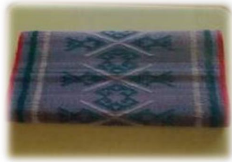
เสื่อกก บ้านหนองตุ้ หมู่ที่ ๑๐