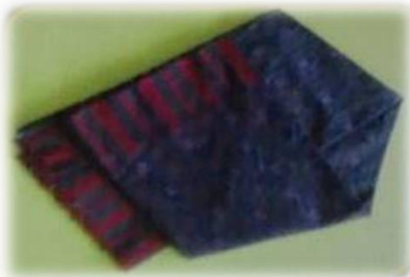
ผ้าไหม บ้านหนองตุ้ หมู่ที่ ๑๐